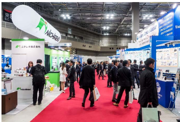
開催状況 [東8ホール]