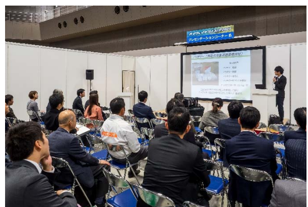
プレゼンテーションコーナー